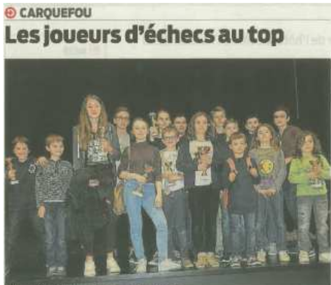
De jeunes champions carquefoulois fiers de leurs résultats.

Les championnats départementaux se sont déroulés le week-end dernier à Gétigné. Les 150 meilleurs jeunes de Loire-Atlantique y participaient, dont 34 Carquefoulois. De la concentration, de la stratégie, de la tactique mais aussi de l'endurance étaient au rendez-vous pour se frotter, sur l'échiquier, aux meilleurs jeunes du département. Au final, un très bon cru avec 5 titres, 5 podiums et 17 qualifiés pour la phase régionale. Le club se hisse à la